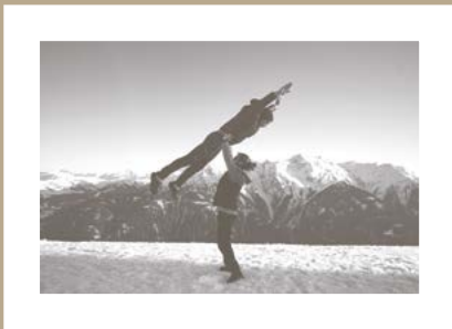
Savoie (73) Immersion aux Saisies Mars 2019